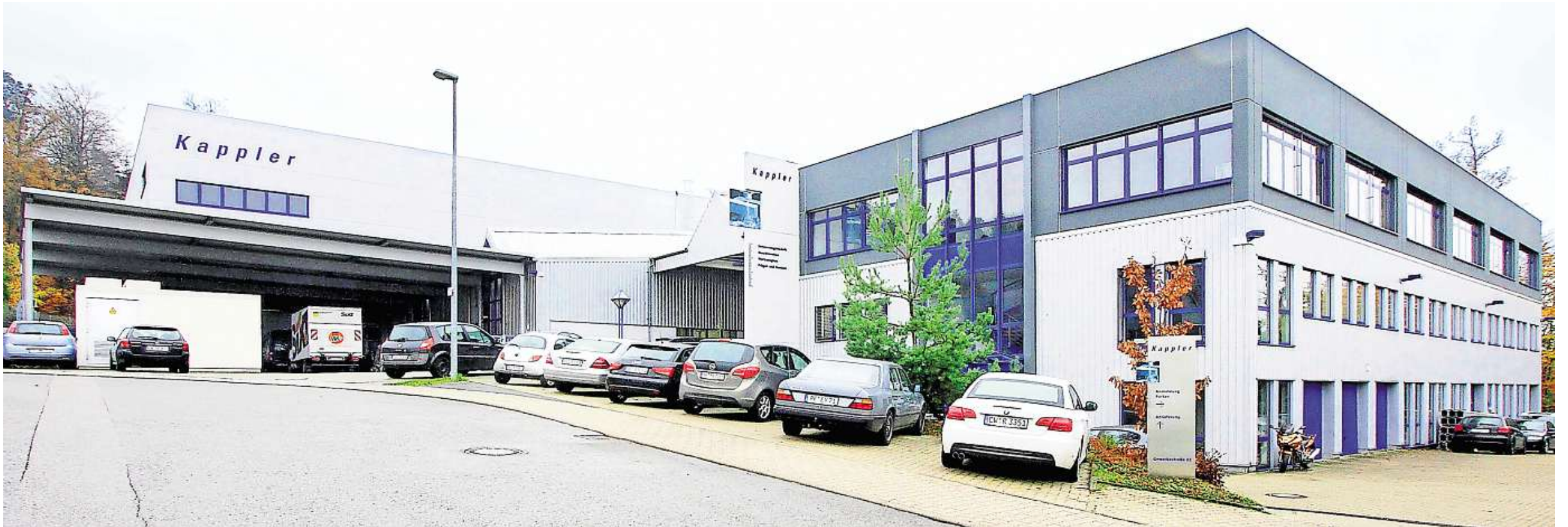
Einheitliches Gesamtbild: Der Erweiterungsbau (links) fällt dem Betrachter kaum auf. Da machte sich bezahlt, dass Harsch schon die beiden ersten Firmenabschnitte gebaut hatte.