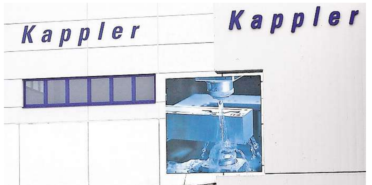
Kappler ist Spezialist für Präzisionswerkzeuge.

Zu den Vorgaben der Bauherren gehörte unter anderem der Einbau eines elektrisch leitfähigen Bodens. Die nachfolgenden Messungen haben ergeben, dass die Ausführung deutlich besser wurde, als ursprünglich gefordert. Zwischenzeitlich wurde im Außenbereich die Aufstockung in die Farbgebung des Bestands eingebunden, so dass sich der Gebäudekomplex als Einheit in die Topografie einfügt.