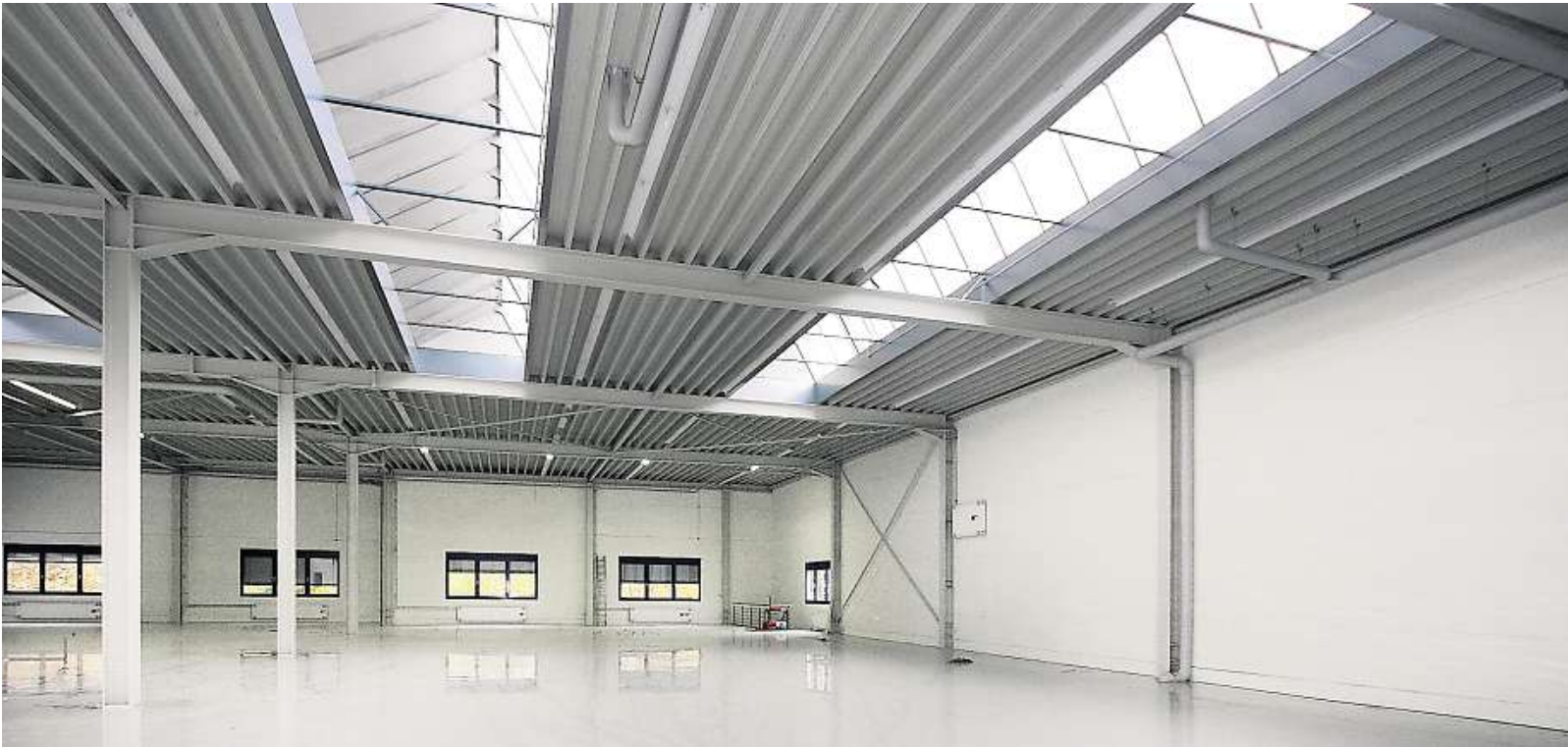
Jede Menge Platz: Der lichtdurchflutete Erweiterungsbau bietet zusätzliche 2300 Quadratmeter Nutzfläche.